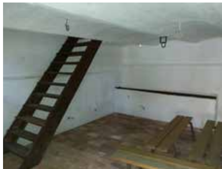
Zásadní rekonstrukci prošly i interiéry hospodářských staveb.

V roce 2017 proběhla další etapa rekonstrukce hospodářských objektů v Domě dějin Holýšovska. Na rekonstrukci poskytlo dotaci Ministerstvo kultury České republiky prostřednictvím programu Podpora obnovy kulturních památek prostřednictvím obcí s rozšířenou působností. Nemovitá kulturní památka areál venkov-