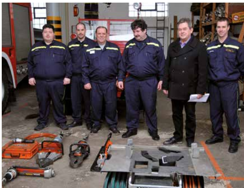
Z krajského hasičského záchraného sboru Plzeňského kraje se holýšovským hasičům podařilo za pomoci města získat moderní vyprošťovací zařízení HOLMATRO.