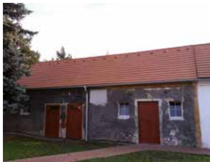
Zatím nejpatrnější změnou na rekonstruovaném objektu jsou repasované dveře a okna.

V roce 2017 proběhla další etapa rekonstrukce hospodářských objektů v Domě dějin Holýšovska. Na rekonstrukci poskytlo dotaci Ministerstvo kultury České republiky prostřednictvím programu Podpora obnovy kulturních památek prostřednictvím obcí s rozšířenou působností. Nemovitá kulturní památka areál venkov-